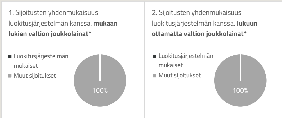
*Näissä kaavioissa "valtion joukkolainat" koostuvat kaikista valtiiovastuista.

Jäljempänä olevissa kahdessa kaaviossa esitetään vihreällä EU:n luokitusjärjestelmän mukaisten sijoitusten vähimmäisprosenttiosuus. Koska ei ole olemassa asianmukaista menetelmää, jolla voitaisiin määrittää valtion joukkolainojen* yhdenmukaisuus luokitusjärjestelmän kanssa, ensimmäisessä kaaviossa yhdenmukaisuus luokitusjärjestelmän kanssa esitetään suhteessa kaikkiin rahoitustuotteen sijoituksiin, myös valtion joukkolainoihin, kun taas toisessa kaaviossa yhdenmukaisuus esitetään ainoastaan suhteessa muihin rahoitustuotteen sijoituksiin kuin valtion joukkolainoihin.